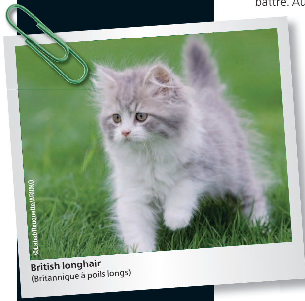
British longhair (Britannique à poils longs)

De santé robuste, le British shorthair nécessite peu de soins particuliers. Comme pour tous les chats, il est important de lui nettoyer régulièrement les yeux à l'aide d'un tissu humide et de vérifier la propreté de ses oreilles. Sa fourrure étant courte, elle s'emmêle peu et un brossage hebdomadaire suffit. Afin de lustrer son poil, on peut aussi passer un gant de toilette humidifié sur sa fourrure. La plupart des chats prennent cela pour une caresse et en redemandent !